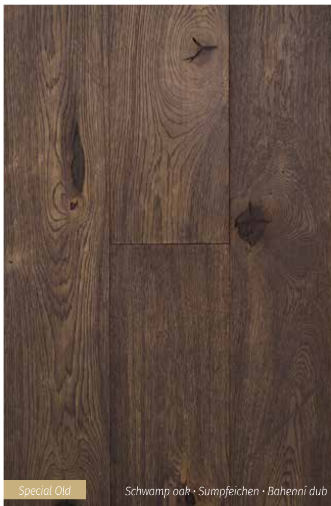
Special Old Schwamp oak · Sumpfeichen · Bahenní dub