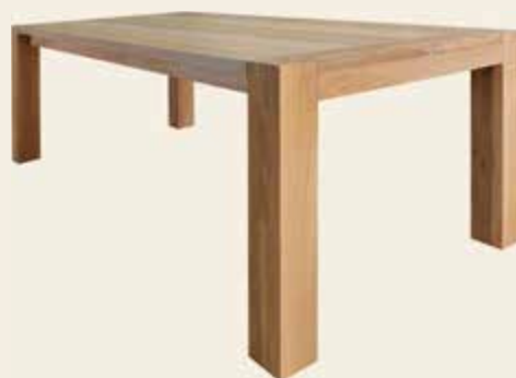
Klooster · Kloster · Monastery Elegance