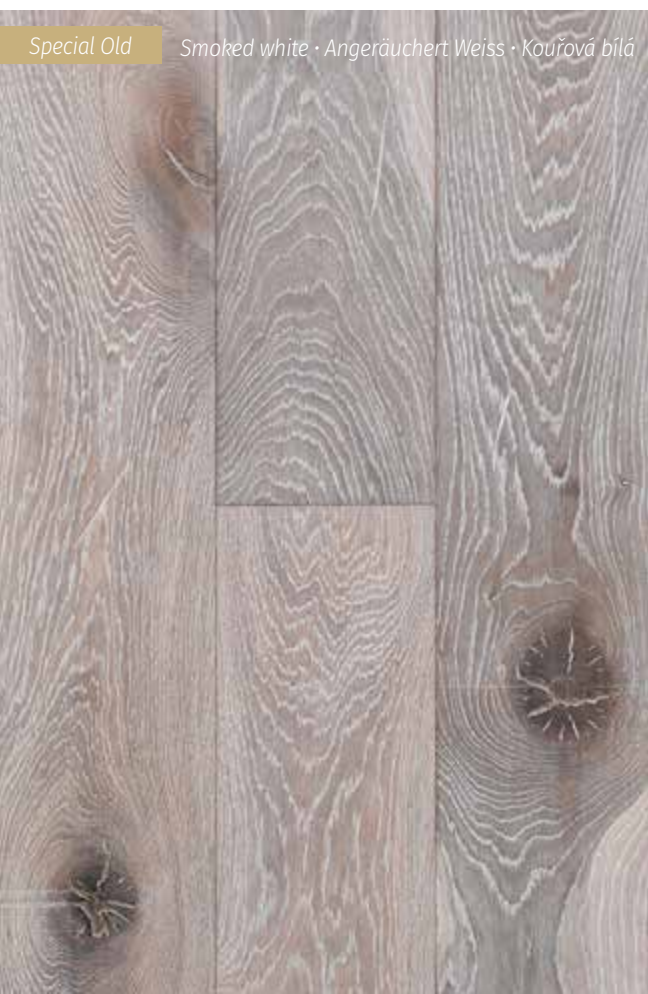
Special Old Smoked white · Angeräuchert Weiss · Kouřová bílá