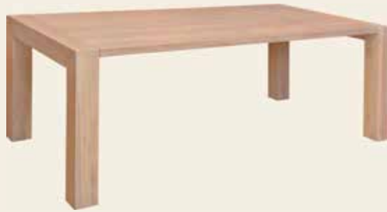
Gasthaus · Gasthaus · Guest House Modern