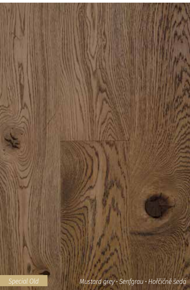
Special Old Mustard grey · Senfgrau · Hořčičně šedá