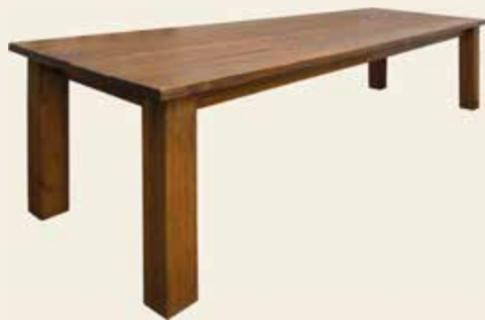
Cube · Würfel · Cube Boeren · Bauern · Farm