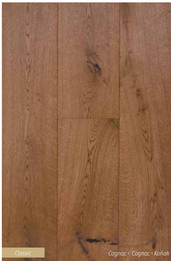
Classic Cognac · Cognac · Koňak