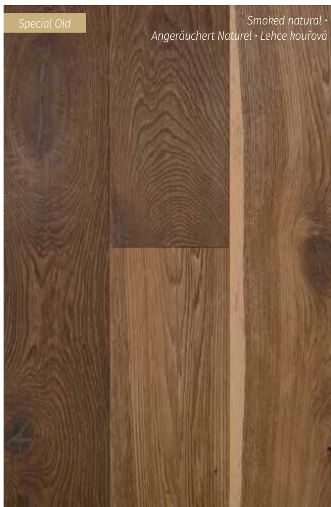
Special Old Smoked natural · Angeräuchert Naturel · Lehce kouřová