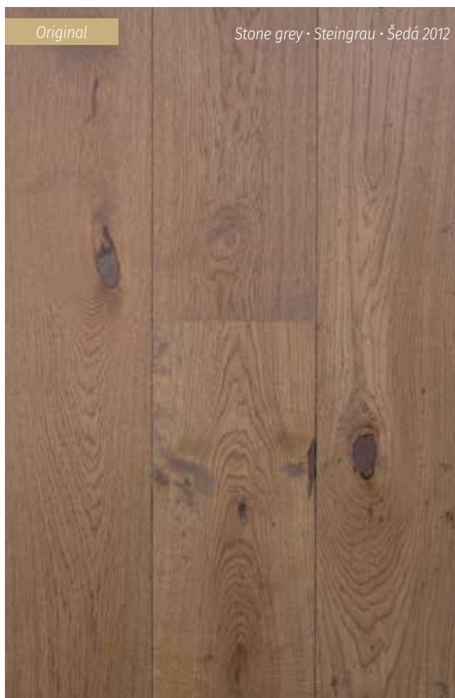
Original Stone grey · Steingrau · Šedá 2012