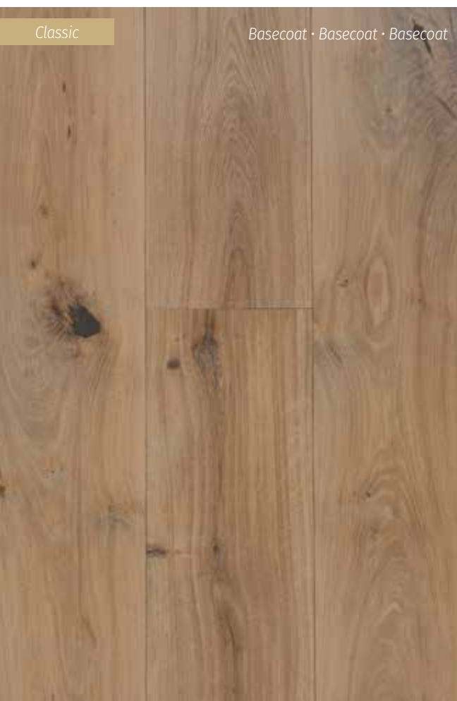
Classic Basecoat · Basecoat · Basecoat