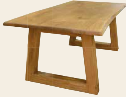
Herberg · Wirthaus · Tavern Country