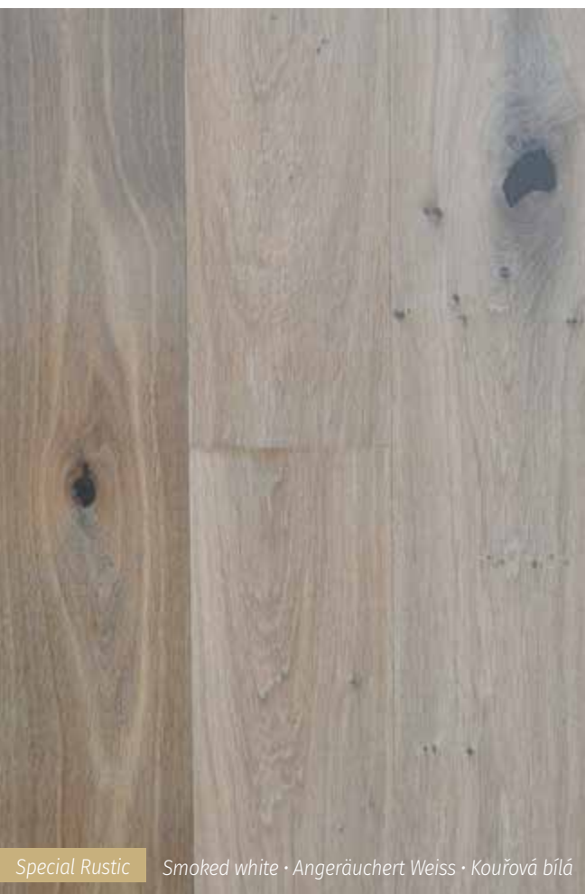
Special Rustic Smoked white · Angeräuchert Weiss · Kouřová bílá