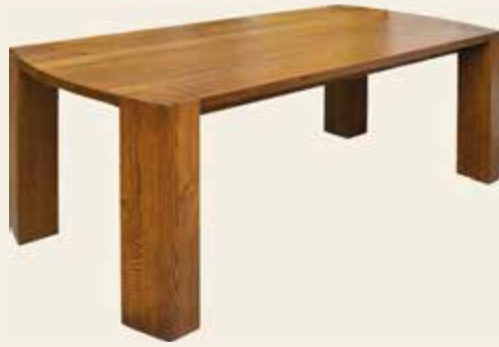
Kasteel · Schloss · Castle Ridder · Ritter · Knight